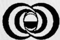
Table de concertation régionale des associations de personnes handicapées de Lanaudière

Base commune du milieu associatif des personnes handicapées de Lanaudière